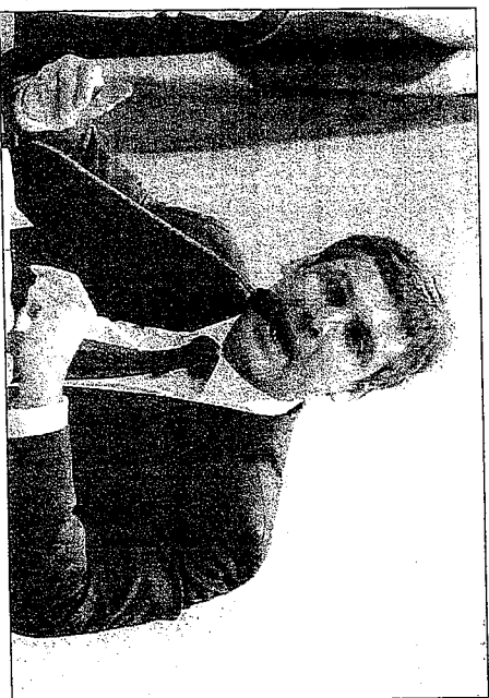
O presidente da CAE, senador Lindbergh Farias (PT-RJ), relator da proposta no Senado

O relator da proposta que desonera o transporte público no País,